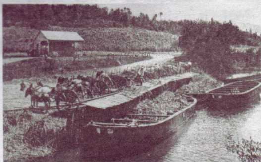
Tibou début 20 ème siècle