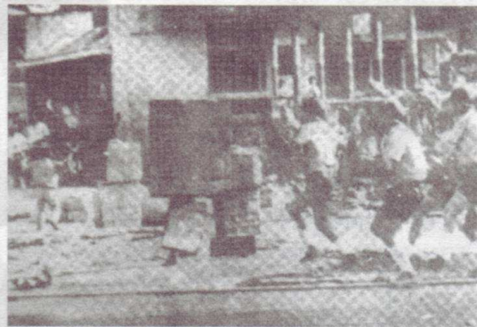
Pointe-à-Pitre (Mé 67)